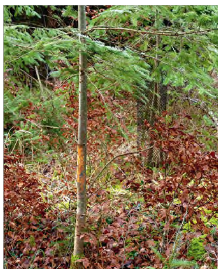
Foto 7 - In primo piano giovane pianta di douglasia che ha subito sfregamento da cervo, in secondo piano individuo coetaneo protetto con shelter .

La douglasia è soggetta a danni causati dalla fauna selvatica e risulta minacciata sia dalla brucatura che dallo sfregamento. Lo sfregamento