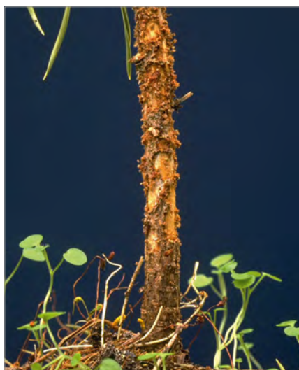
Foto 4 - Fusticino di giovane douglasia, dove è visibile l'attività dell'ilobio ( Hylobius abietis ) che ha mangiato la corteccia.

Phaeocryptopus gaeumannii detta cascola fuliginosa (Foto 6) si diffonde soprattutto in popolamenti densi ed ambienti umidi. A seconda della