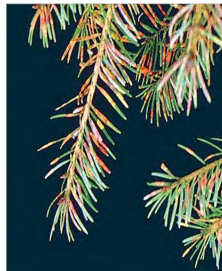
Foto 3 - Rametti danneggiati dal minatore degli aghi ( Contarinia pseudotsugae ).

due contributi che rispettivamente trattano: