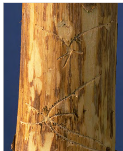
Foto 5 - Caratteristiche gallerie con forma a stella realizzate dal pitiografo ( Pityophthorus pityographus ).

Per quanto riguarda gli attacchi agli apparati