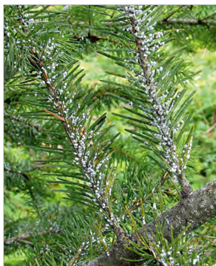
Foto 2 - Rametti di douglasia su cui sono ben visibili le secrezioni bianche cerose prodotte dall'attacco dell'afide della douglasia ( Gilletteella cooleyi ).