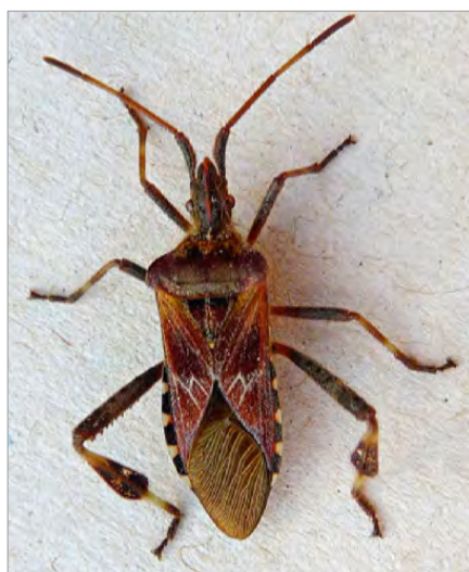
Foto 1 - Cimicione del pino ( Leptoglossus occidentalis ). Caratterizzato da zampe particolarmente spesse.